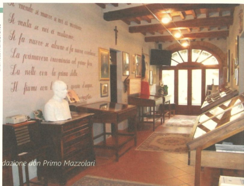
citazione don Primo Mazzolari

in atto l'idea di aprirsi ai lontani. La risposta di don Primo è molto franca: il problema riguarda l'animo dell'apostolo, non è questione di attività pratiche.