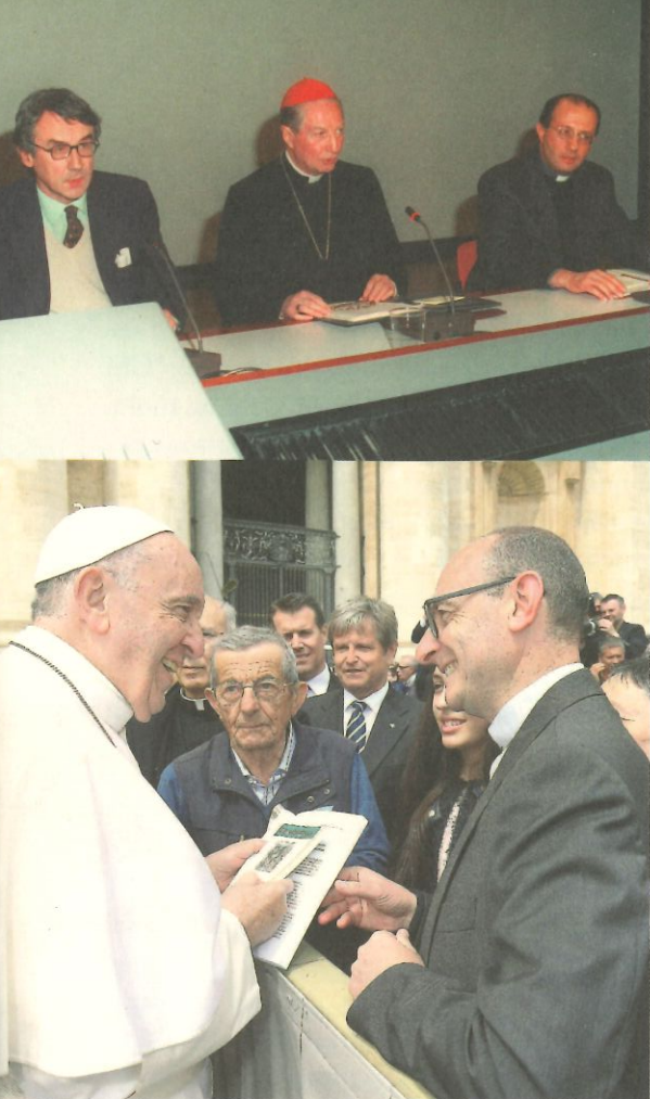
FONDAZIONE CARLO MARIMARTINI.IT